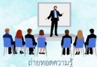
ถ่ายทอดความรู้

กรมวิชาการเกษตรเป็นหน่วยงานหลักร่วมกับ กรมการข้าว กรมประมง กรมปศุสัตว์ กรมหม่อนไหม กรมพัฒนาที่ดิน กรมตรวจบัญชีสหกรณ์ กรมส่งเสริมการเกษตร กรมส่งเสริมสหกรณ์ สำนักงานปลัดกระทรวงเกษตรและสหกรณ์ และสำนักงานเศรษฐกิจการเกษตร